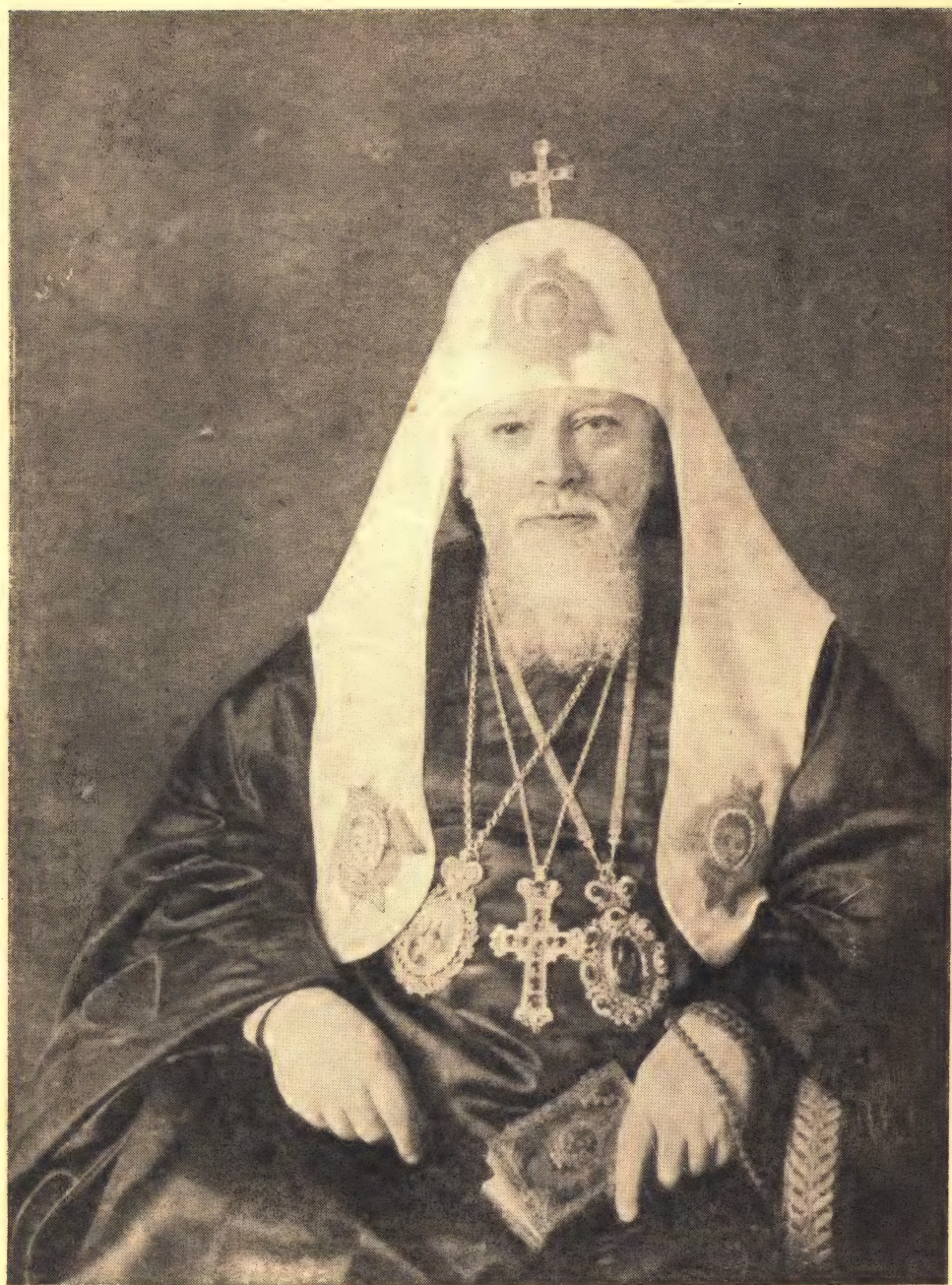
Святейший Алексий Патриарх Московский и всея Руси